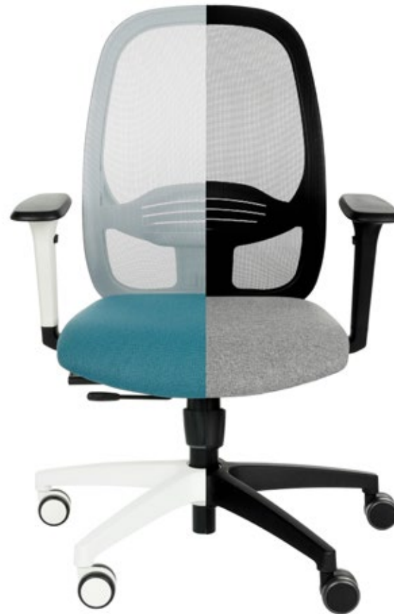
WERSJA WS (biały stelaż)